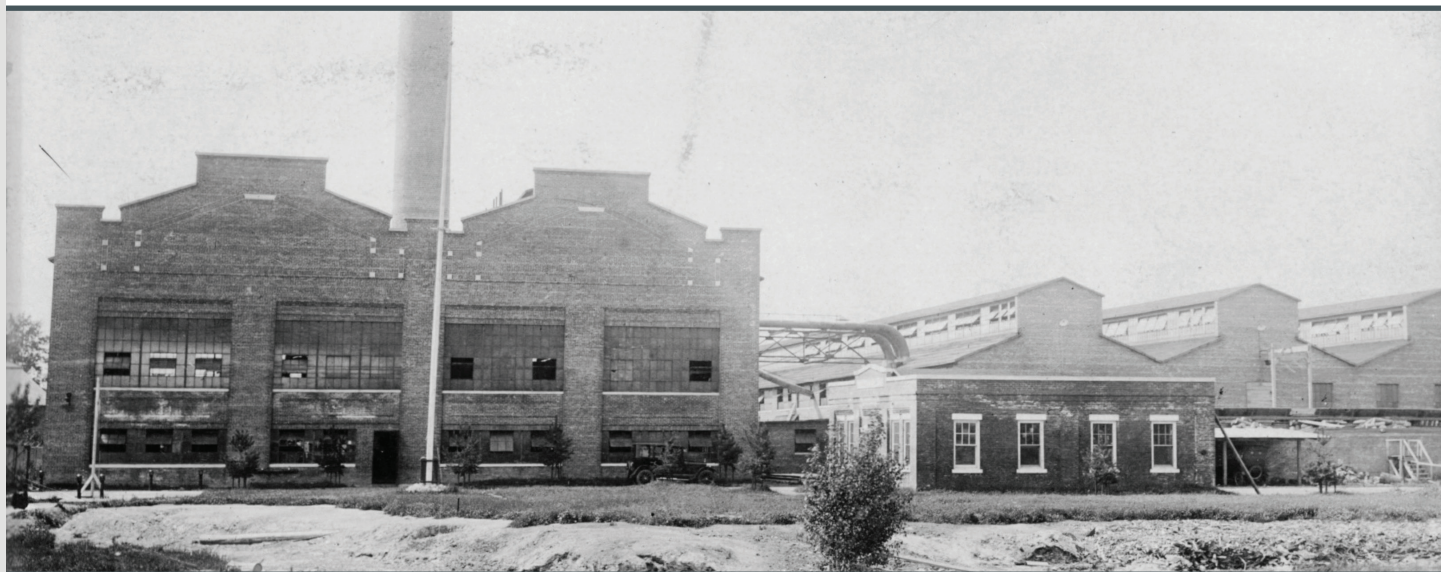
L'usine de Berthierville à l'époque où celle-ci appartenait à la compagnie World Match Corporation.